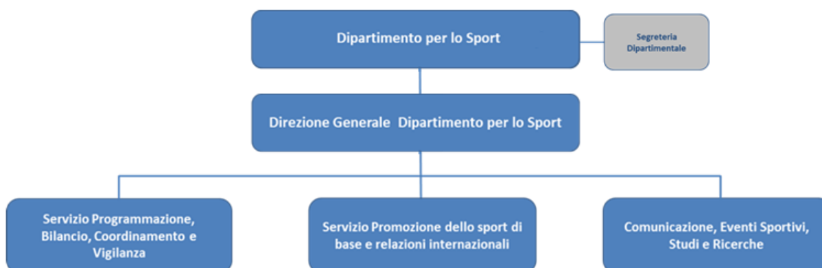
Figura 1 – Organigramma del Dipartimento per lo Sport

L'Ufficio è articolato nei seguenti Servizi: